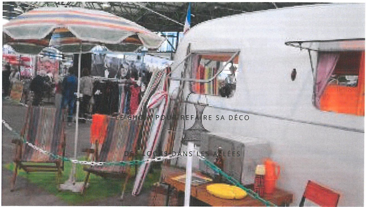
De quoi rappeler des souvenirs au public