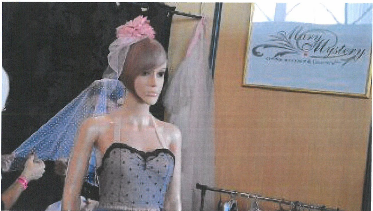
Mariée vintage !