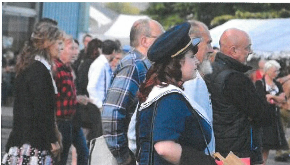
Tenues des années vintage