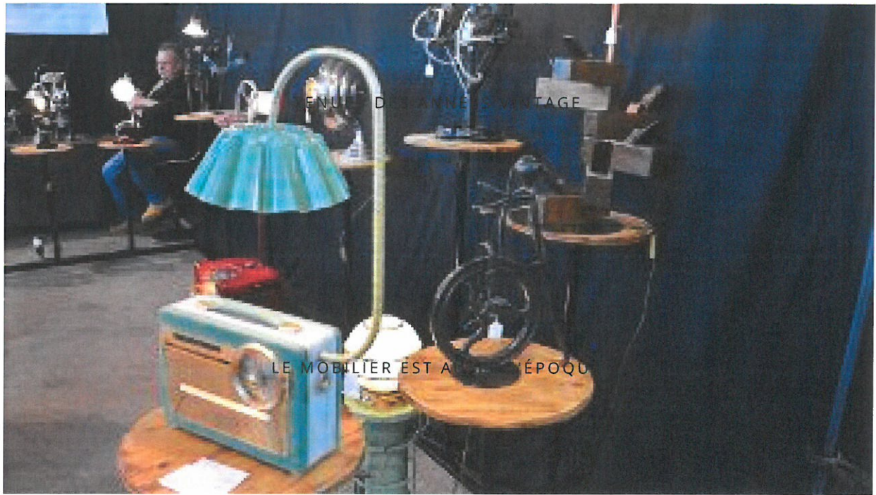
Le choix pour refaire sa déco