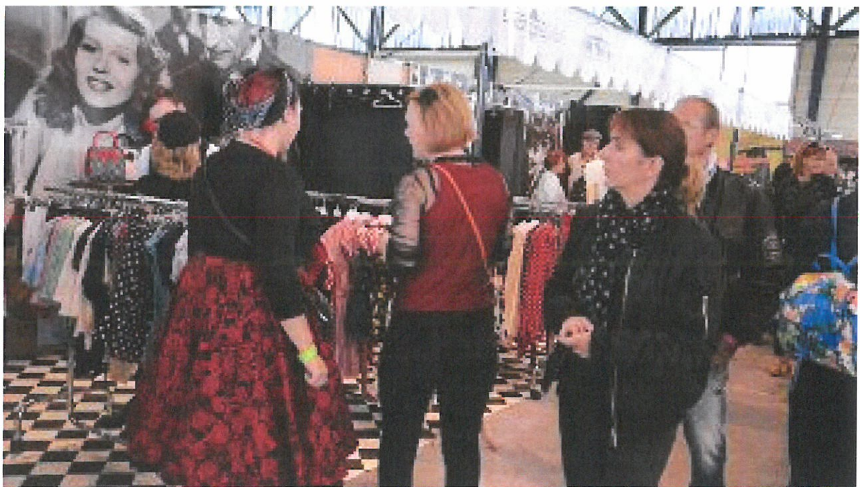
Des looks dans les allées