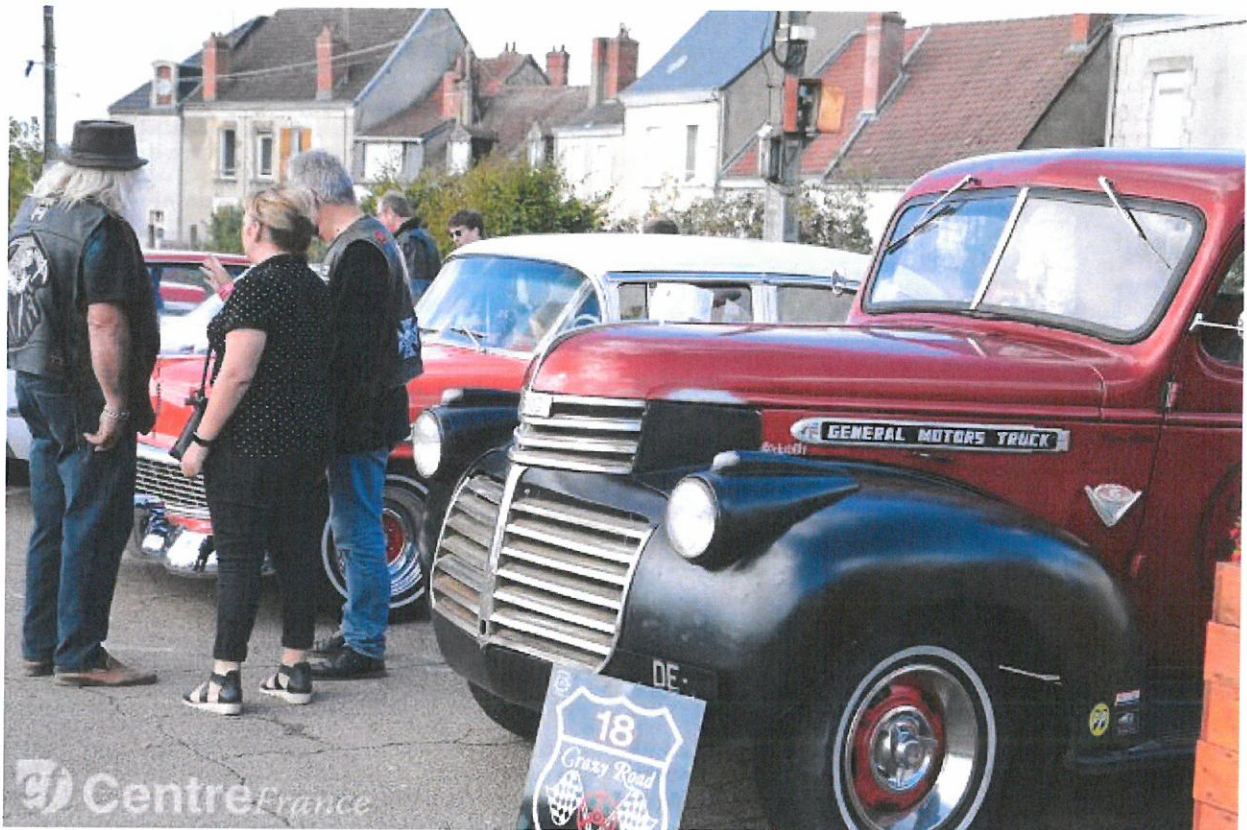
Voitures exposées

Les Années Vintage ont lieu pour la deuxième fois à Vierzon ce week-end. Retrouvez l'événement en images, histoire de vous donner envie d'aller y faire un saut ce soir jusqu'à minuit ou dimanche.