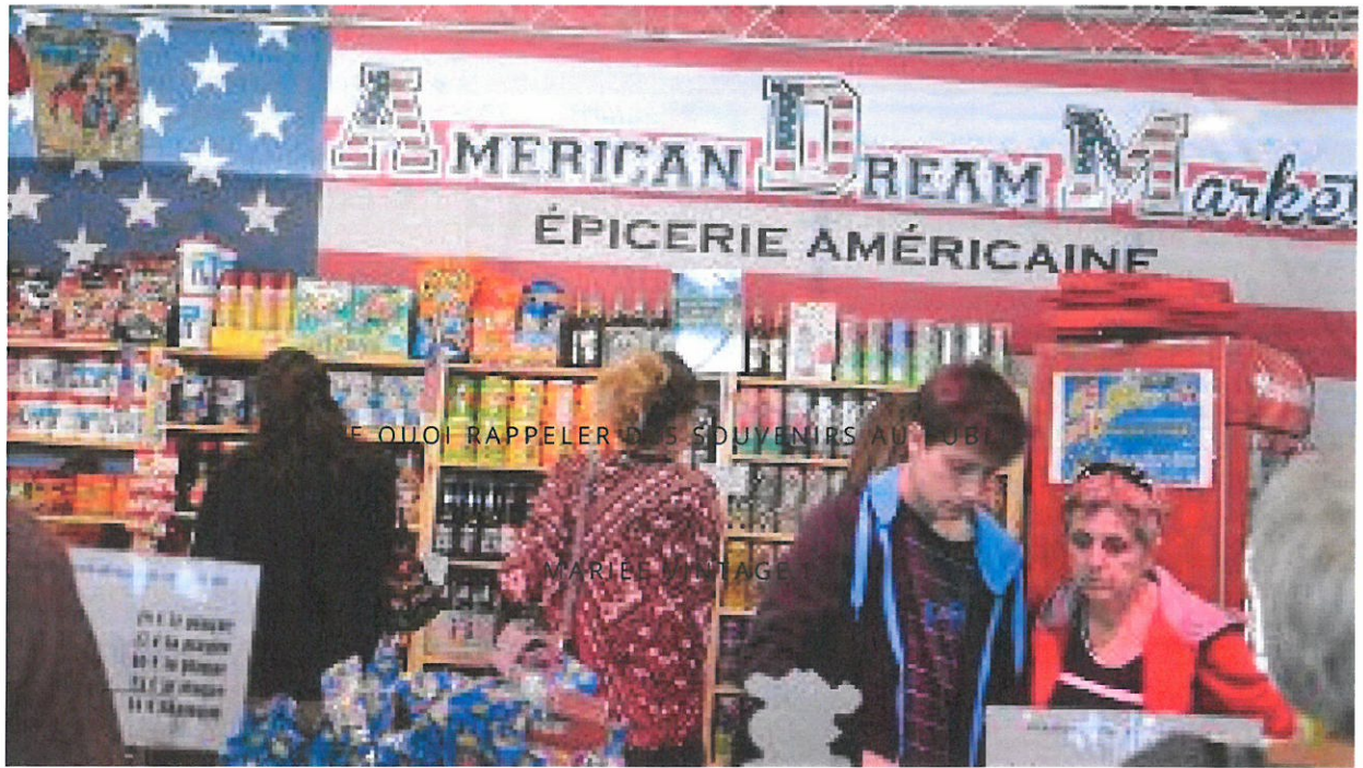
Made in America